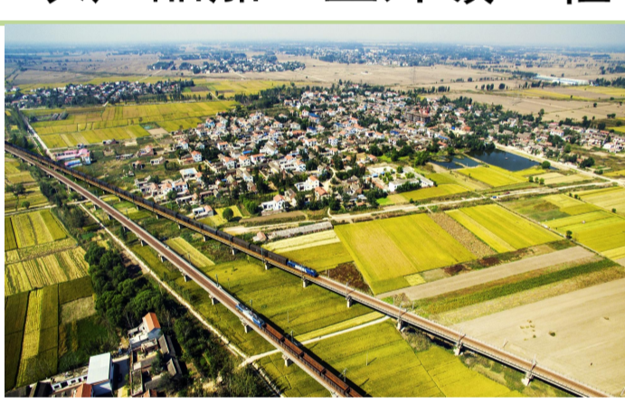
三产融合发展工程