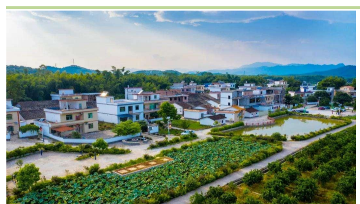
美丽乡村建设工程