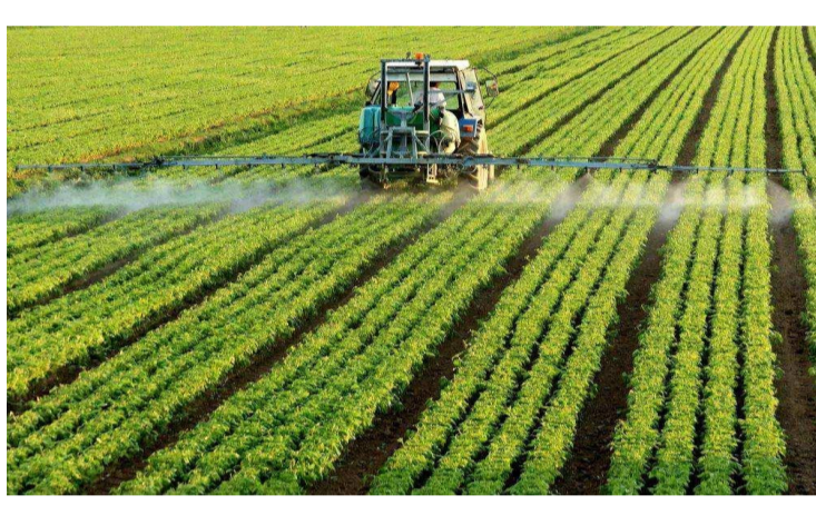
粮食高效生产工程