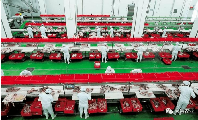
农产品加工业升级工程