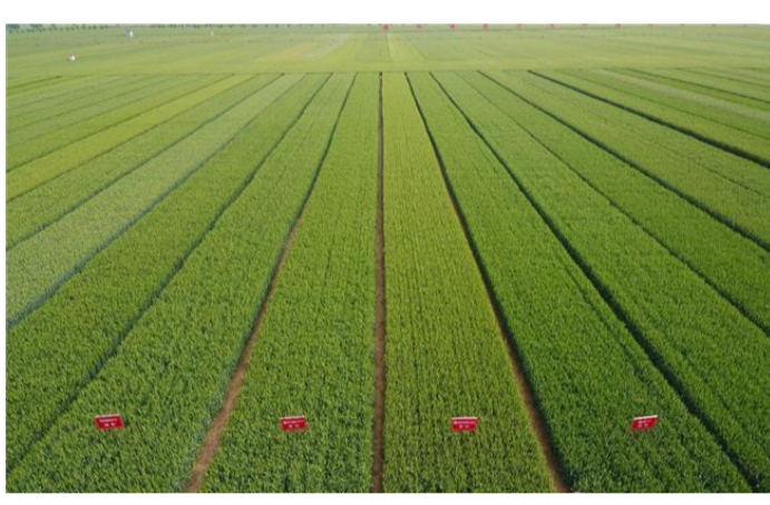
现代种业提升工程