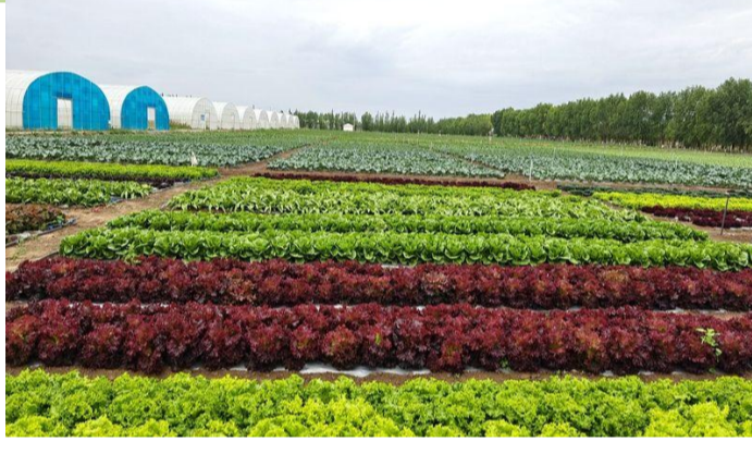
特色产业壮大工程