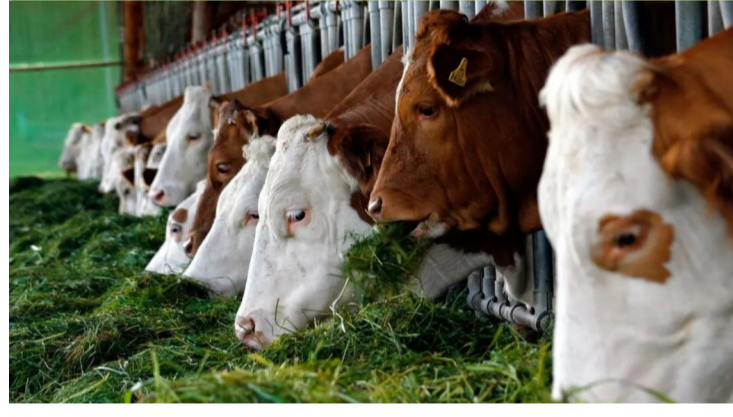
现代畜牧业转型升级工程