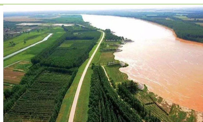
沿黄绿色发展工程