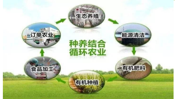
循环农业建设工程